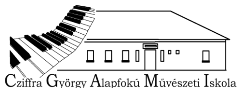
Cziffra György Alapfokú Művészeti Iskola

individuum, rész – egész, önreflexiók – saját tér, személyes tárgy, valós és szubjektív idő, környezet hatása, titok, magány, pusztulás)